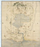
「伯耆国河村郡東郷荘下地中分図」(横本) 東京大学史料編纂所蔵