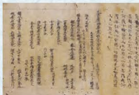
【国指定重要文化財】 松尾社一切経 大本山妙蓮寺藏