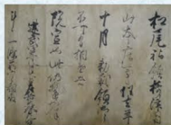
【新出文書】後光厳上皇院宣 松尾大社藏