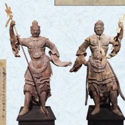
二天(毘沙門天(左)・持国天(右)) 身延山久遠寺藏