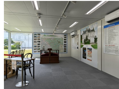
ガイダンス施設内部。鳥取城跡や仁風閣のことがよくわかるよ！