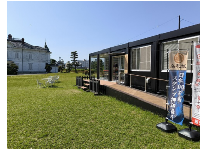
ガイダンス施設は、仁風閣の敷地内にあります。