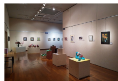
あおや文化まつり2023の様子